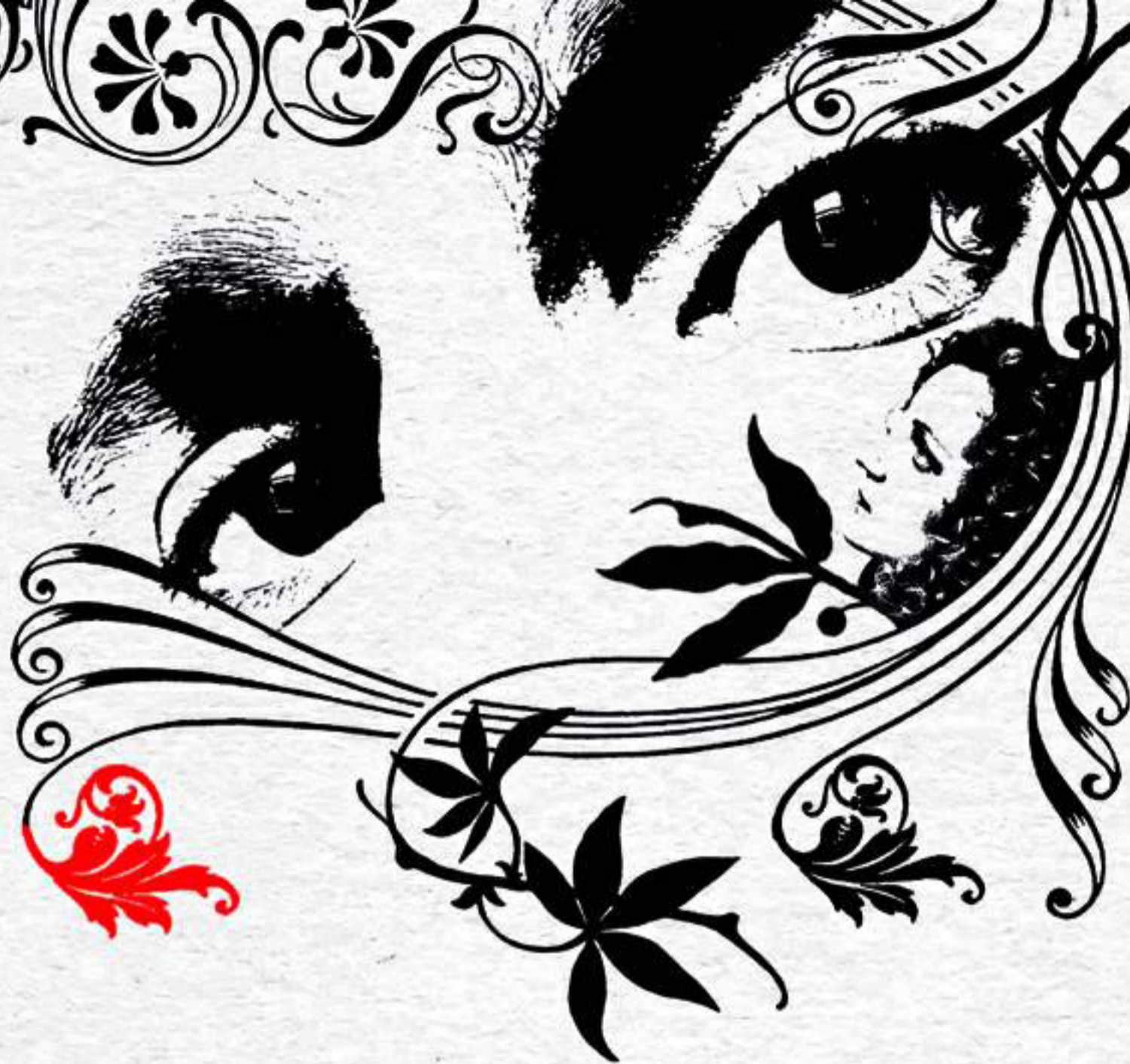
J.C. Torre & Nadja Voss

Der Mensch in seiner Umgebung: Die menschliche Figur in ihrer existentiellen Vielfalt - das ist der Ausgangspunkt dieses Kurses. „Figuren malen, daß kann ich nicht.“ - Eine falsche Bescheidenheit, deshalb möchte Mike Keilbach das Interesse der Kursteilnehmer auf das alltägliche Menschenbild lenken und auf dessen Faszination. Er wird Bildmaterial aus seinem Archiv als Anregungen zur Verfügung stellen. So lernen Sie frei mit Farbe und Form umzugehen und entdecken Ihre Liebe zur Farbe neu.. Unkompliziert werden Themen, wie Farbkontraste und Farbkompositionen bearbeitet. Gleichzeitig wird Sie Herr Keilbach in Ihrer individuellen Farbigkeit & Fähigkeit entsprechend beraten und Sie in Ihrer „Eigen-Art“ bestärken. Ziel des Kurses ist es, keine Angst vorm „Menschenbild“ und intensiven Farben zu haben.